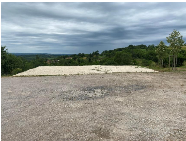
Travaux réalisés au parking de Lesturgie

De plus, l'ancienne plate-forme où gisaient déchets végétaux et gravats a été nettoyé pour agrandir la surface afin de permettre aux associations de disposer d'un espace pour proposer des animations.