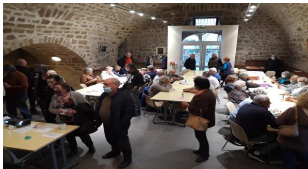
Concours de belote - Curemonte

Nous poursuivons régulièrement nos rencontres belotes et jeux de société tous les 15 jours dans notre local à côté de la salle polyvalente. Sur ce thème, nos joueurs ont pu se confronter à de nouveaux partenaires au cours d'un concours que nous avons organisé et qui a réuni une cinquantaine de joueurs du département.